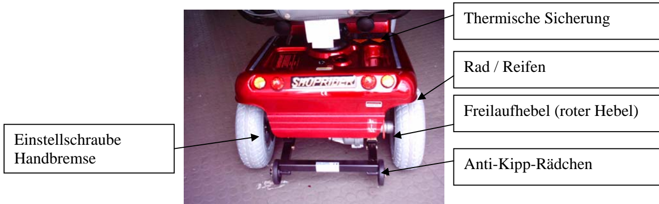
Bild 4 - Heckansicht